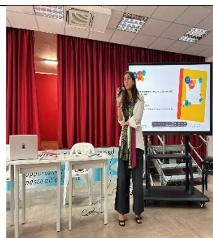
Evento Moltiplicatore a Palermo

A partire da questa estate, i partner hanno iniziato a pianificare e organizzare i loro eventi moltiplicatori , nel tentativo di diffondere i risultati del progetto. I nostri partner di Lisbona hanno ospitato il loro evento di successo nel luglio 2024, con il contributo di tutti i partner, e i nostri partner italiani lo hanno organizzato il loro a settembre 2024. Entrambi i moltiplicatori, rivolti principalmente agli insegnanti, hanno fornito un motivo per mostrare le risorse del progetto per l'insegnamento e l'apprendimento della seconda lingua e per evidenziare l'importanza dell'aspetto digitale nei tentativi di ridefinire la classe tradizionale.