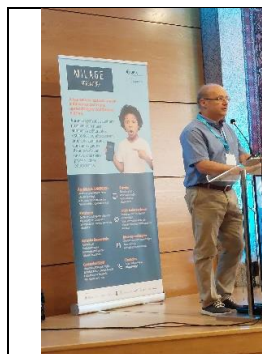
Evento Moltiplicatore a Lisbona

A partire da questa estate, i partner hanno iniziato a pianificare e organizzare i loro eventi moltiplicatori , nel tentativo di diffondere i risultati del progetto. I nostri partner di Lisbona hanno ospitato il loro evento di successo nel luglio 2024, con il contributo di tutti i partner, e i nostri partner italiani lo hanno organizzato il loro a settembre 2024. Entrambi i moltiplicatori, rivolti principalmente agli insegnanti, hanno fornito un motivo per mostrare le risorse del progetto per l'insegnamento e l'apprendimento della seconda lingua e per evidenziare l'importanza dell'aspetto digitale nei tentativi di ridefinire la classe tradizionale.